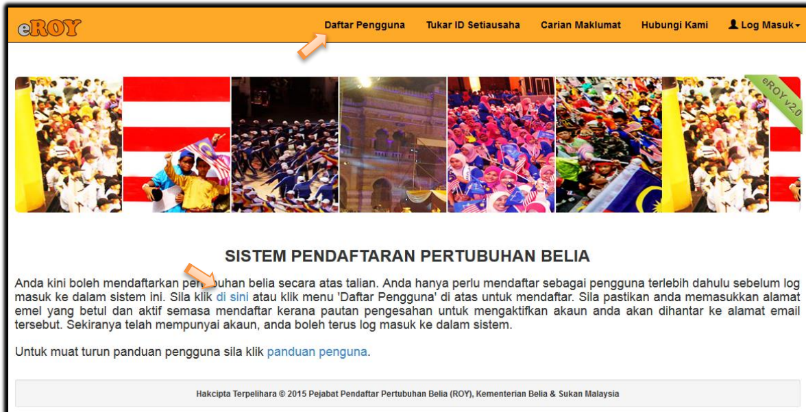
Gambarajah 1 : Laman Utama Sistem eROY v2

Sistem Pendaftaran Pertubuhan Belia (eROY) boleh diakses melalui :- http://eroyv2.gov.my Laman utama seperti di Gambarajah 1 akan dipaparkan. Untuk penggunaan kali pertama, sila mendaftar melalui menu ' Daftar Pengguna ' atau perkataan ' di sini ' pada keterangan seperti anak panah pada Gambarajah 1.