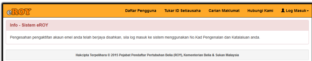
Gambarajah 5 : Mesej Pemberitahuan - Pengesahan emel berjaya diaktifkan

Klik pada pautan seperti anak panah di atas untuk mengesahkan pengaktifan akaun emel anda dan sistem akan memaparkan mesej seperti Gambarajah 5 sebagai tanda pengesahan telah berjaya.